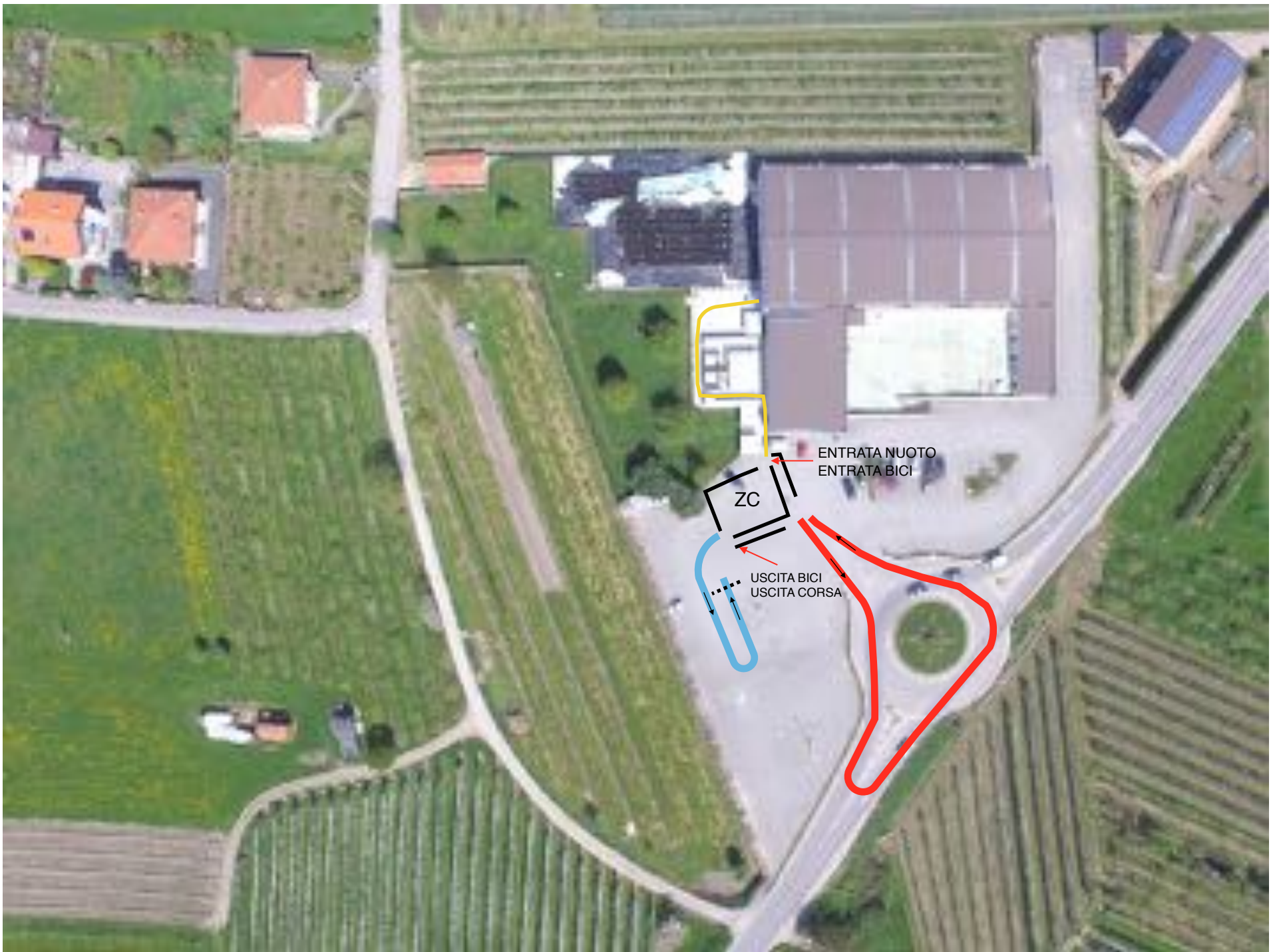
PERCORSO MINI CUCCIOLI ■ NUOTO 25 METRI ■ BICI 250 METRI ■ CORSA 100 METRI